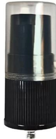
18/415 Dosadora Preta Estriada