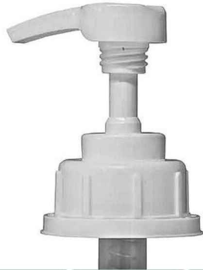
42/410 / Pump Pro / Branca