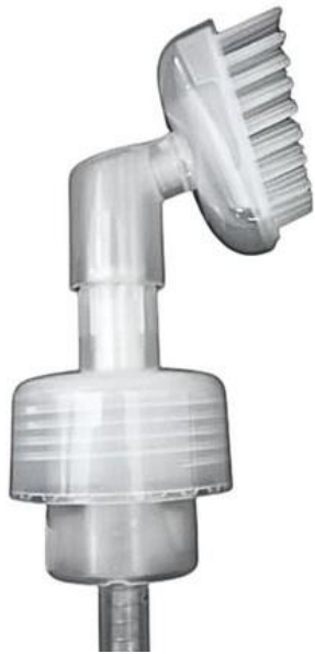
42/410 Espumadora Escova Natural