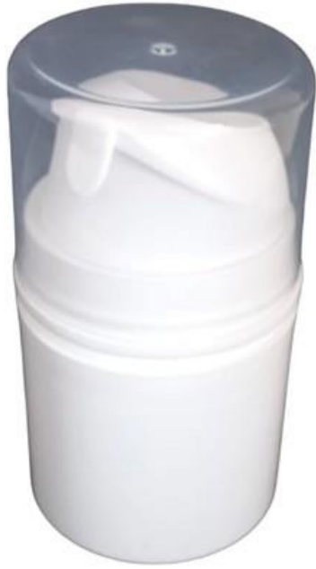
50ml / Air Less / Branca