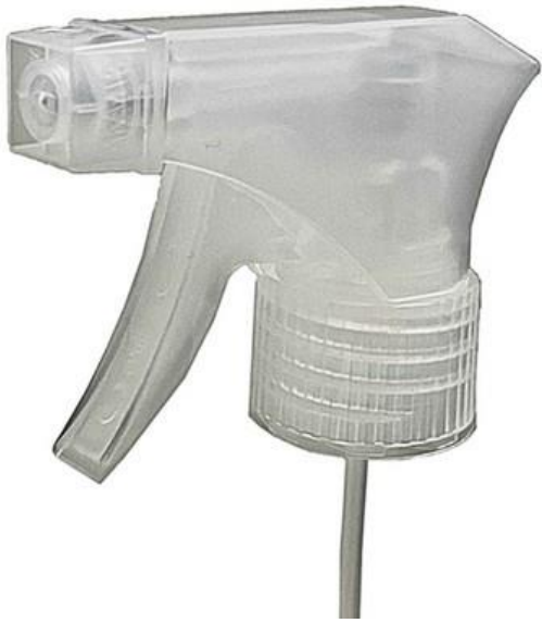
28/410 Trigger MD Natural Estriada