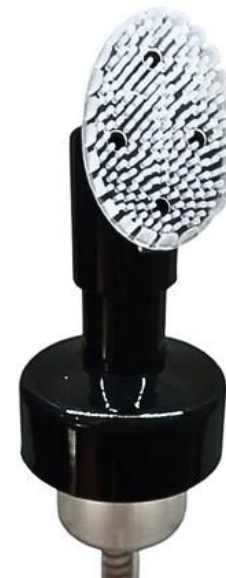
42/410 Espumadora Silicone Preta