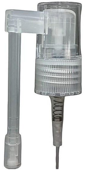
18/410 Nasal 52mm Natural Estriada