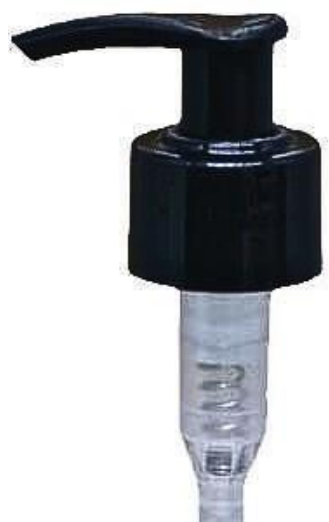
28/410 / Pump / Preta