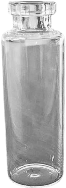
15ml 15mm Frasco Vidro