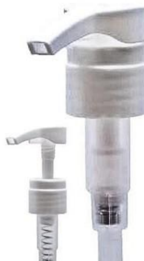
28/410 / Pump Pro / Branca