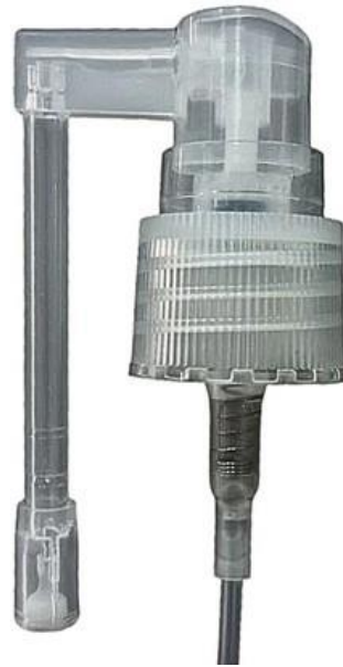
20/410 Nasal 52mm Natural Estriada