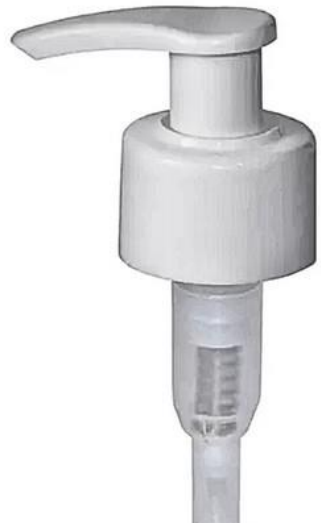
24/410 Pump Branca