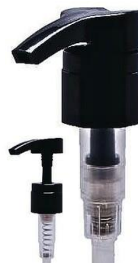
28/410 / Pump Pro / Preta