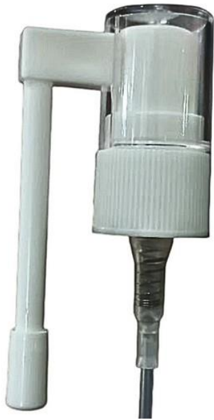
18/410 Nasal 52mm Branca Estriada