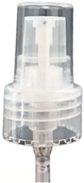
24/410 / Dosadora / Natural Lisa