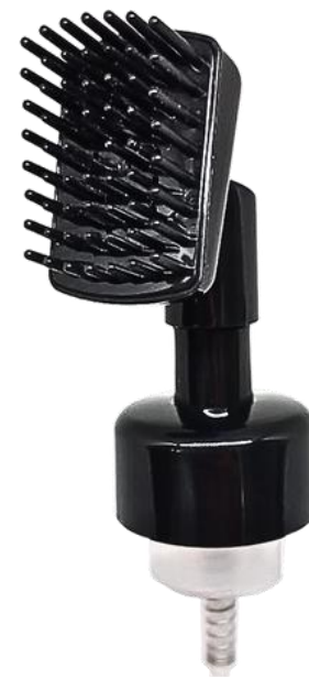
42/410 Espumadora Escova Preta