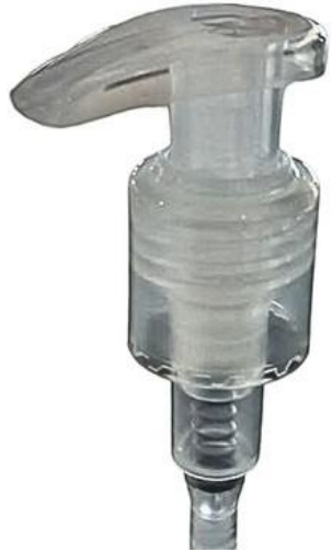
24/415 Gota Natural