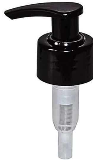
24/410 Pump Preta