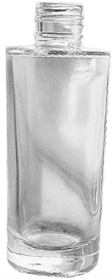
60ml 20mm Frasco Vidro