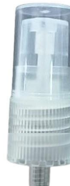
18/415 Dosadora Natural Estriada