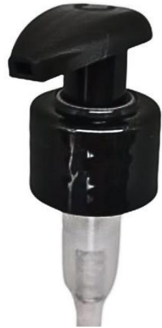
28/410 Gota Preta