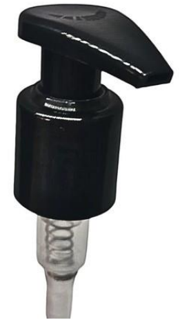
24/415 Gota Preta