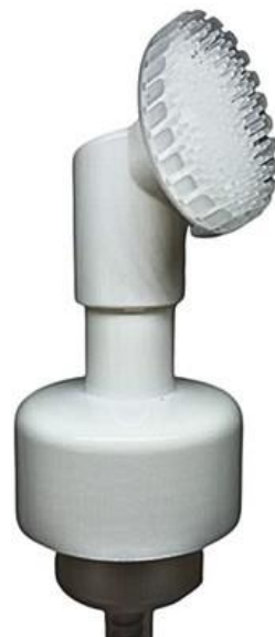
42/410 Espumadora Silicone Branca