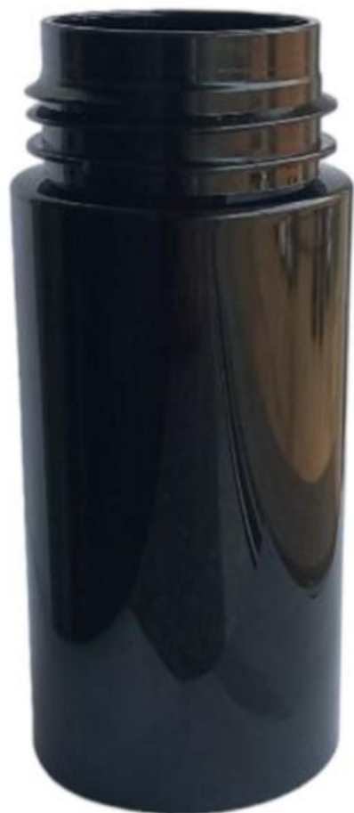
42/410 150ml Frasco Plástico Preto