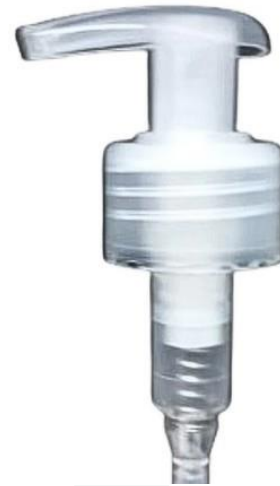
28/410 Gota Natural