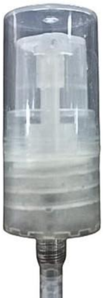
18/410 Dosadora Natural Lisa