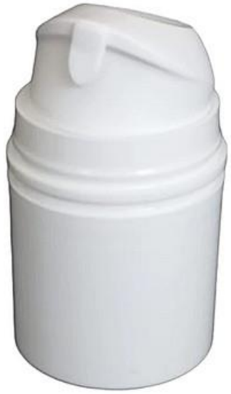
30ml / Air Less / Branca