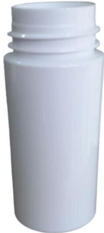
42/410 100ml Frasco Plástico Branco