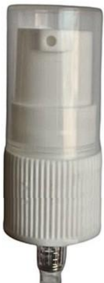
18/415 Dosadora Branca Estriada