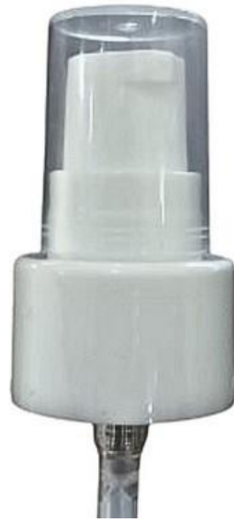
24/410 / Dosadora / Branca Lisa