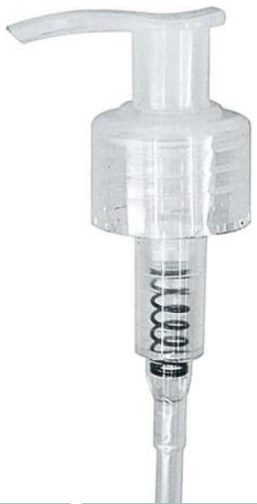
24/410 Pump Natural