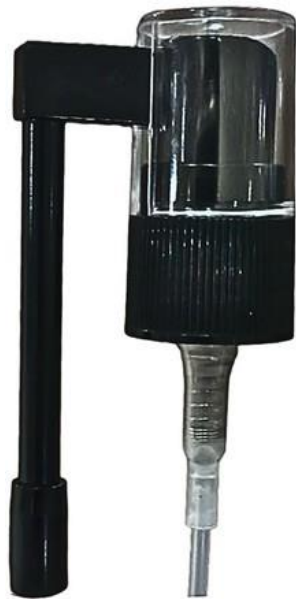
18/410 Nasal 52mm Preta Estriada