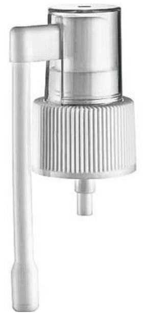
20/410 Nasal 52mm Branca Estriada