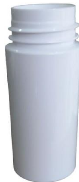
30/410 50ml Frasco Plástico Branco