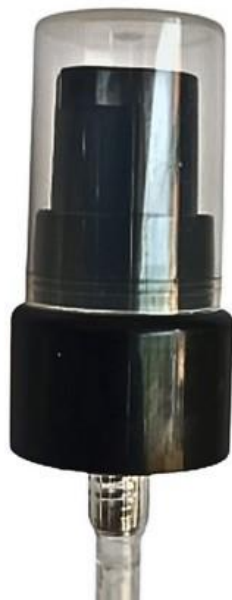
20/410 / Dosadora / Preta Lisa