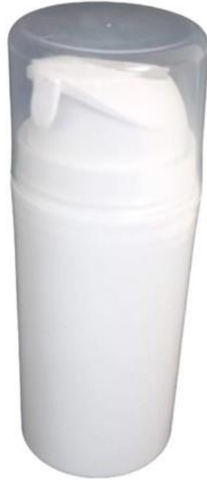
100ml / Air Less / Branca