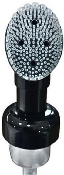
30/410 Espumadora Silicone Preta