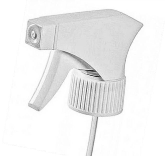
28/410 Trigger MD Branca Estriada