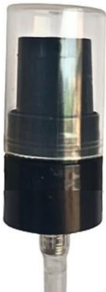
18/410 Dosadora Preta Lisa