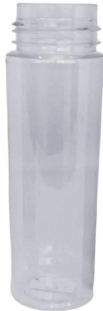
42/410 200ml Frasco Plástico Natural