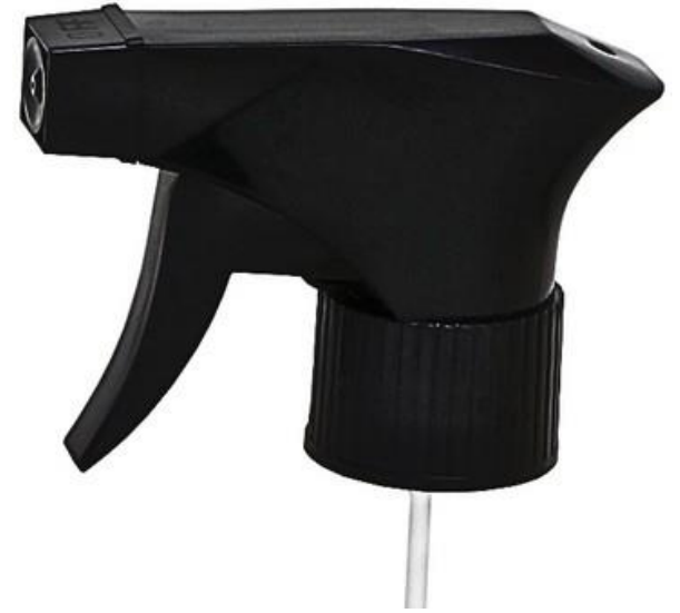
28/410 Trigger MD Preta Estriada