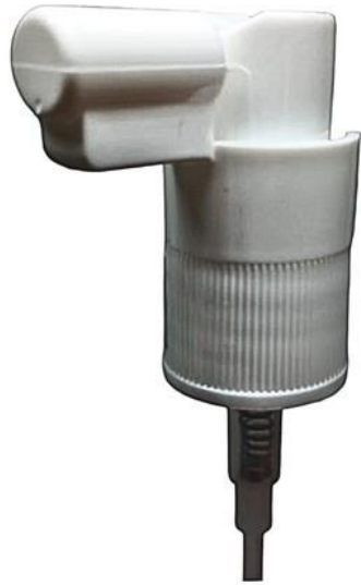
18/410 Nasal 22mm Branca Estriada