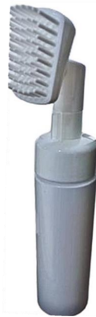
42/410 Espumadora Escova Branca