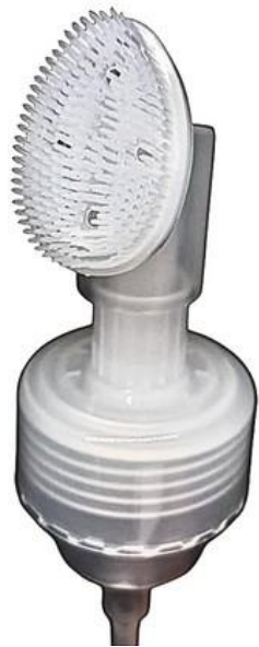
42/410 Espumadora PE Natural