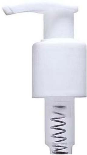
24/415 Pump Branca