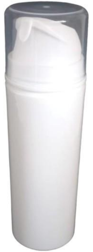
150ml / Air Less / Branca