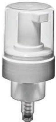
28/410 Espumadora Branca