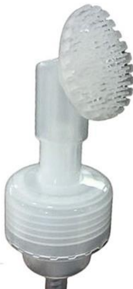
42/410 Espumadora Silicone Natural