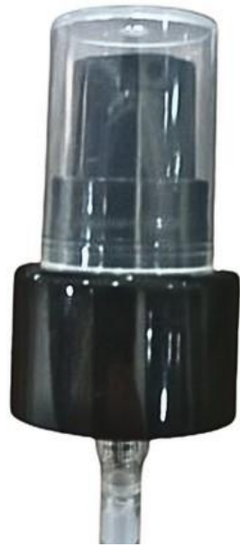
24/410 / Dosadora / Preta Lisa