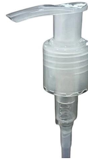
24/415 Pump Natural