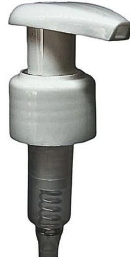
24/410 Gota Branca