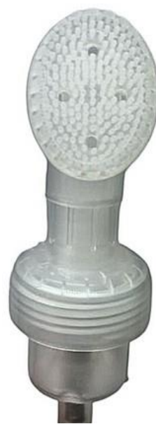
30/410 Espumadora Silicone Natural