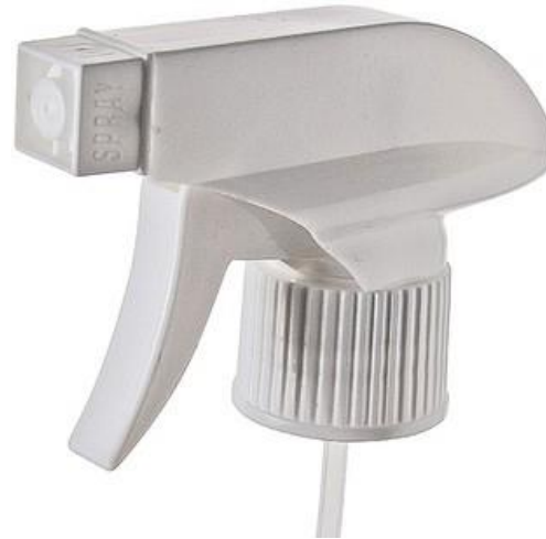
28/410 Trigger MH Branca Estriada