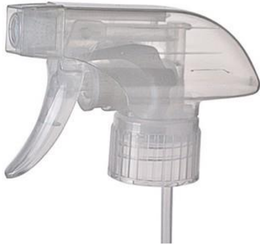
28/410 Trigger MH Natural Estriada