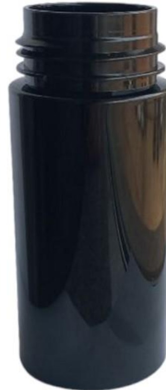
42/410 100ml Frasco Plástico Preto