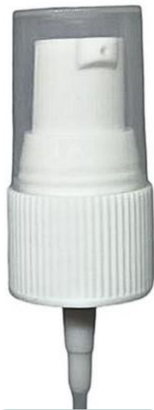
20/410 / Dosadora / Branca Estriada