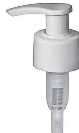
28/410 Pump Branca