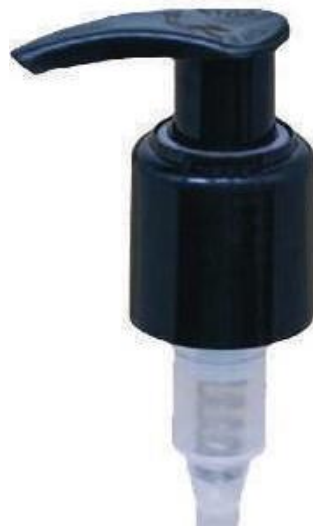
24/415 Pump Preta