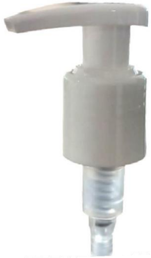
24/415 Gota Branca