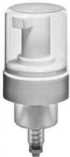
42/410 Espumadora Branca