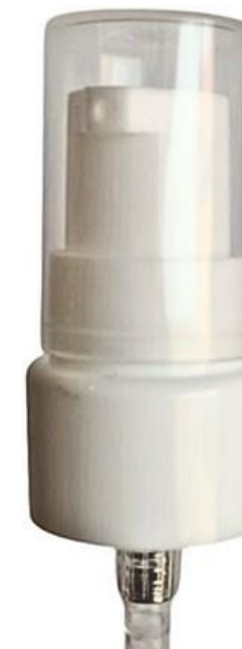
20/410 Dosadora Branca Lisa