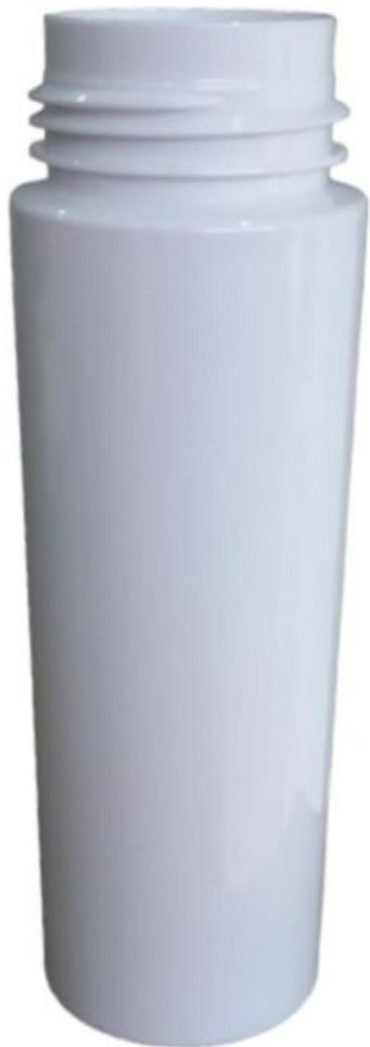
42/410 200ml Frasco Plástico Branco