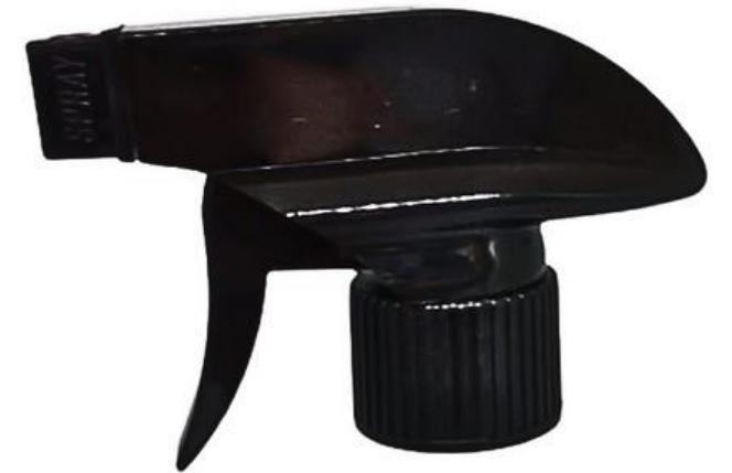
28/410 Trigger MH Preta Estriada