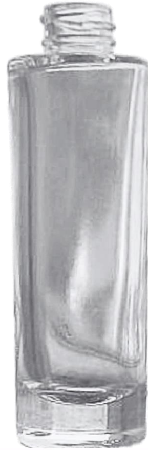
30ml 18mm Frasco Vidro