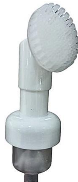
30/410 Espumadora Silicone Branca