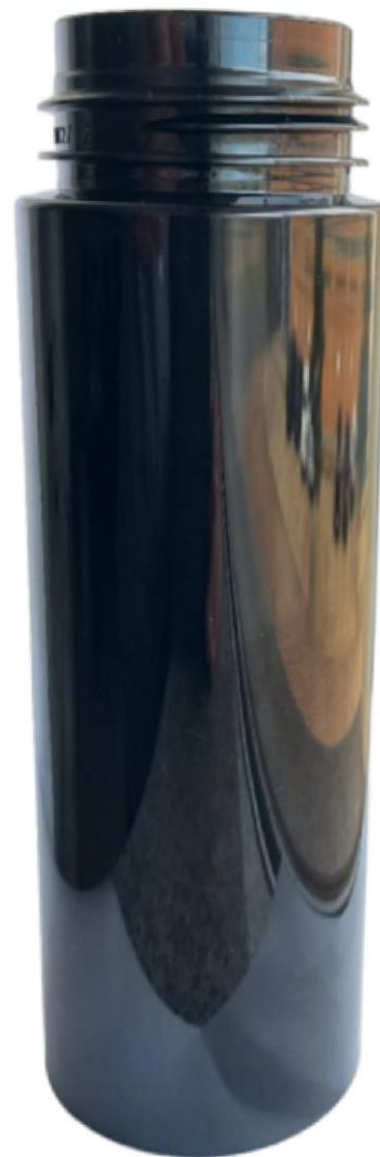
42/410 200ml Frasco Plástico Preto