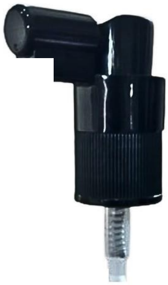
18/410 Nasal 22mm Preta Estriada