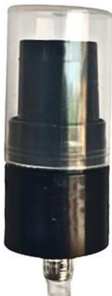
18/415 Dosadora Preta Lisa