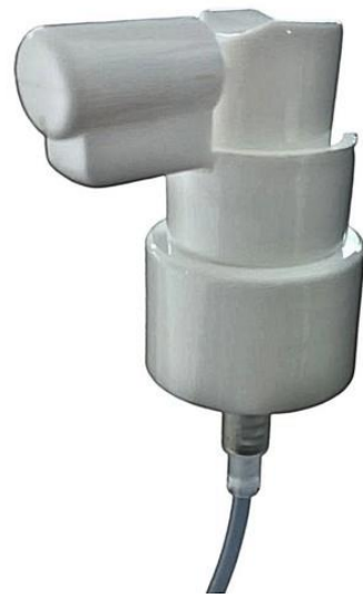
24/410 Nasal 22mm Branca Lisa