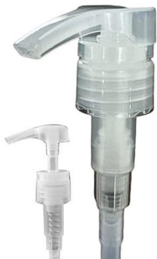
28/410 / Pump Pro / Natural