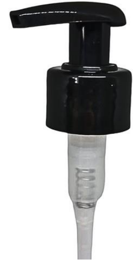
24/410 Gota Preta