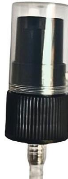
18/410 Dosadora Preta Estriada