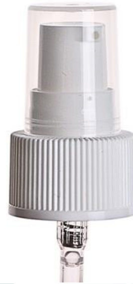
28/410 / Dosadora / Branca Estriada