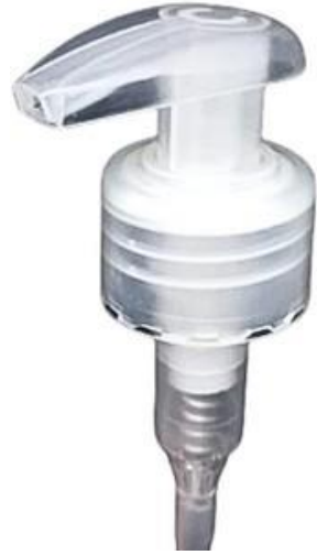
24/410 Gota Natural