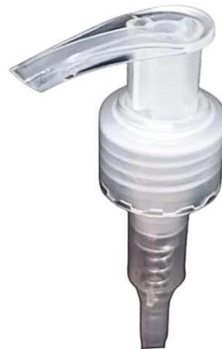
28/410 Pump Natural