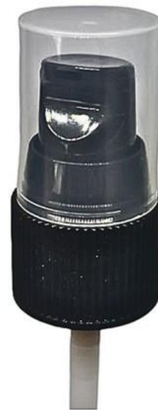
20/410 / Dosadora / Preta Estriada