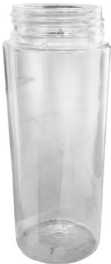
42/410 150ml Frasco Plástico Natural