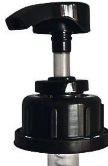
42/410 / Pump Pro / Preta